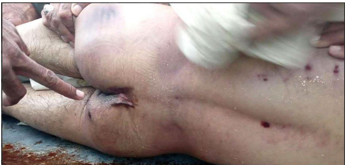
Тело Алламурата Худайрамова со следами пыток