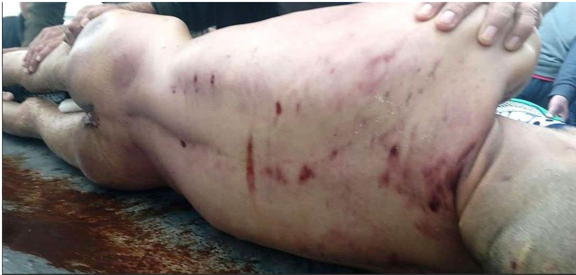
Тело Алламурата Худайрамова со следами пыток